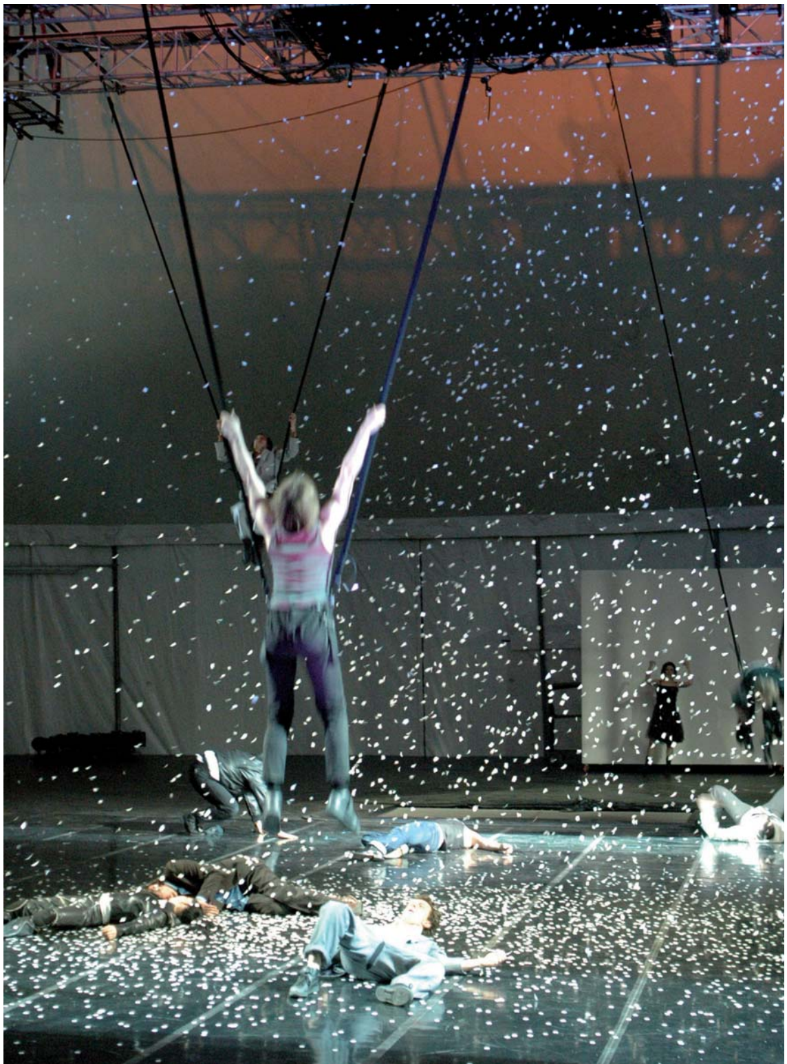
Torinodanza - Il colore bianco Ideazione e regia Giorgio Barberio Corsetti - Coreografia Fatou Traoré