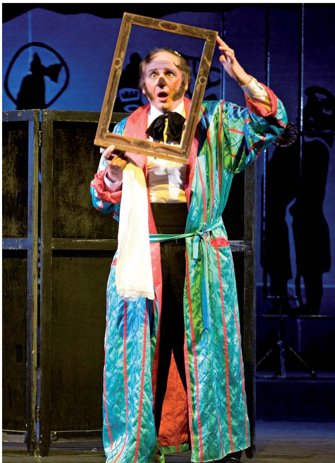
Il naso di Dmitrij Šostakovič Evgenij Bolučevskij (Kovalev)