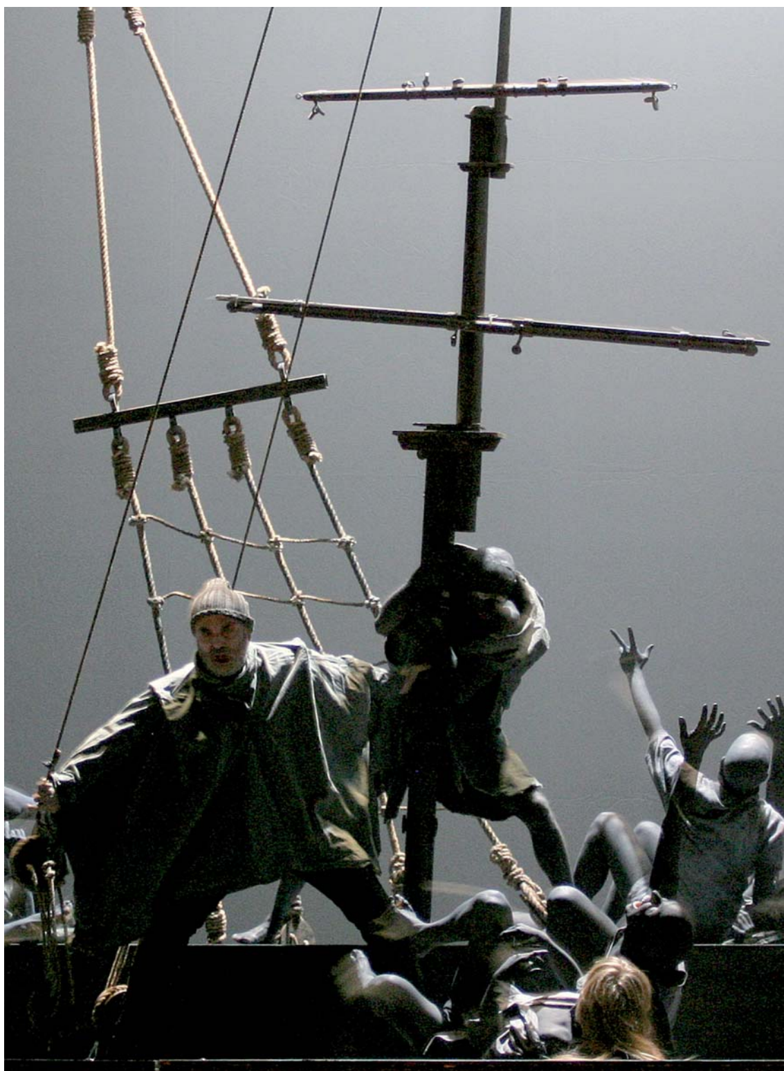
La tempesta di Henry Purcell e Carlo Galante - Prima esecuzione assoluta La tempesta evocata nel Prologo dell'opera