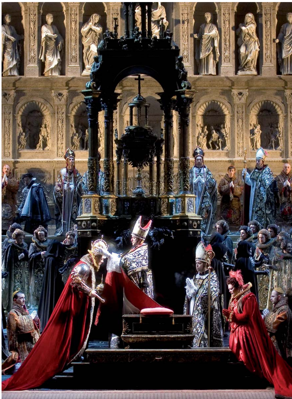
Don Carlo di Giuseppe Verdi L'incoronazione di Filippo II (Atto II)