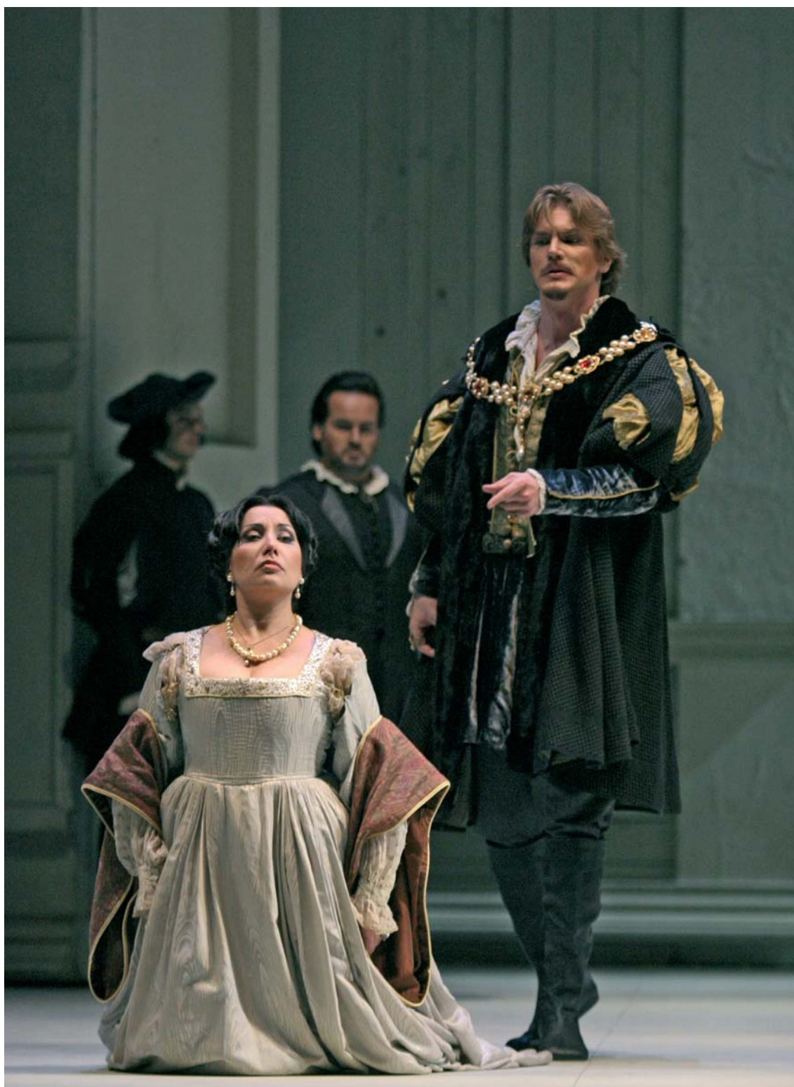
Anna Bolena Musica di Gaetano Donizetti