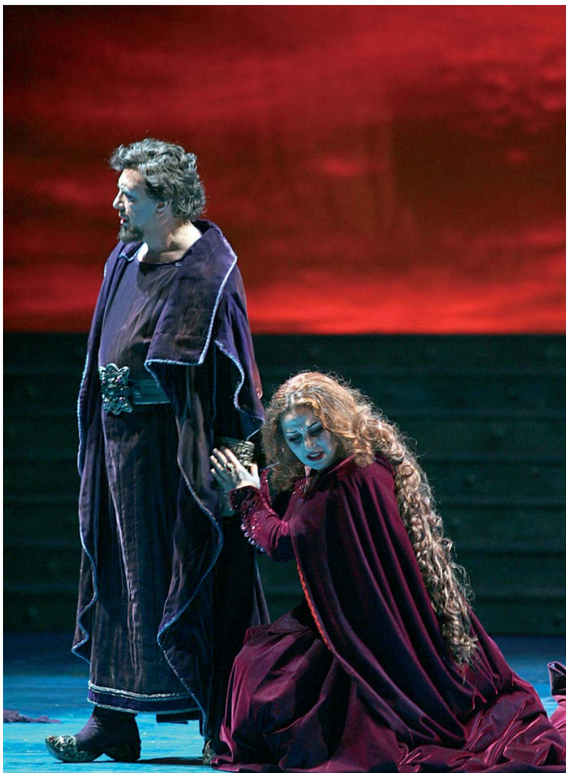
Il trovatore Musica di Giuseppe Verdi