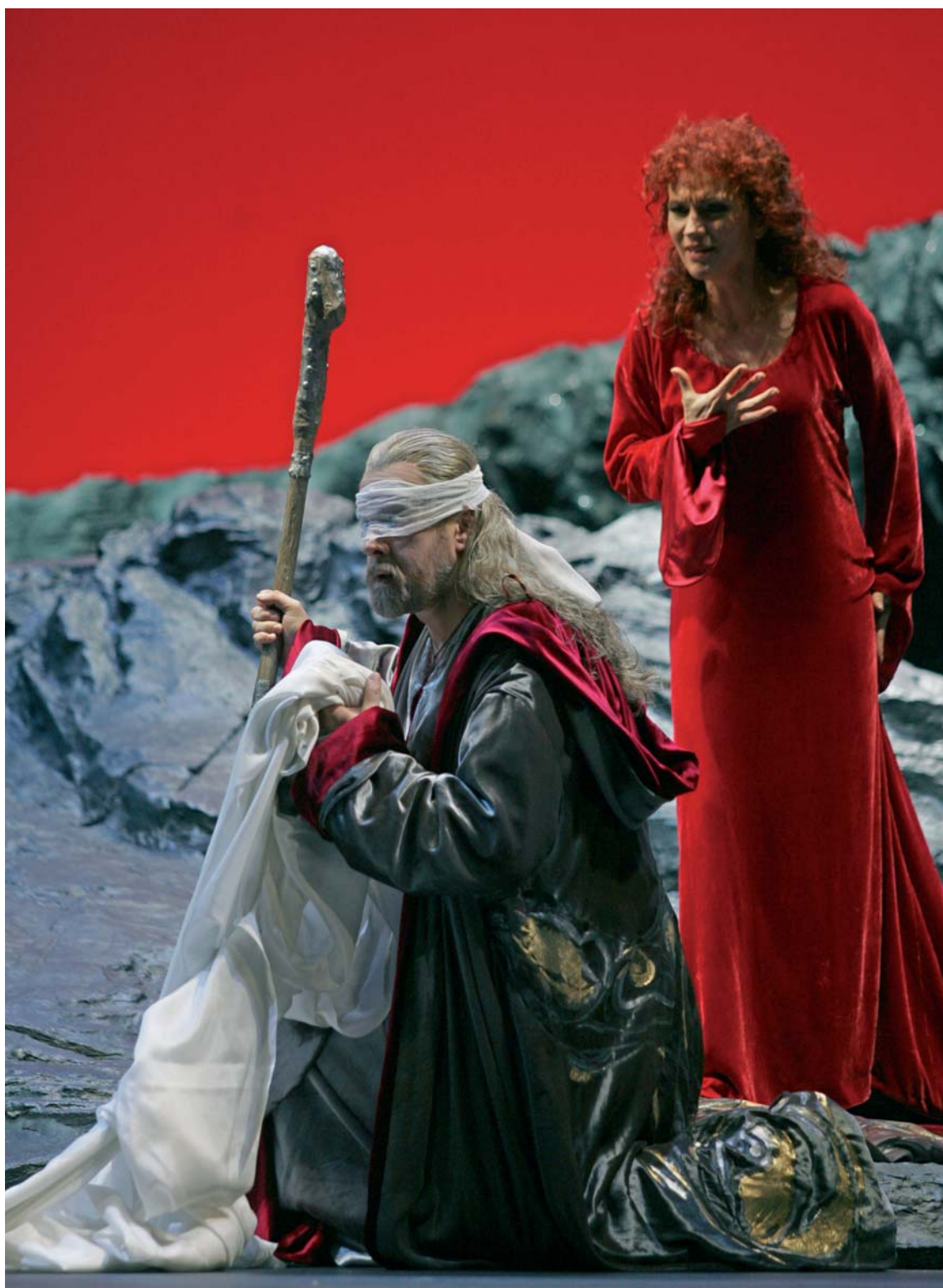
L'amore dei tre re Musica di Italo Montemezzi