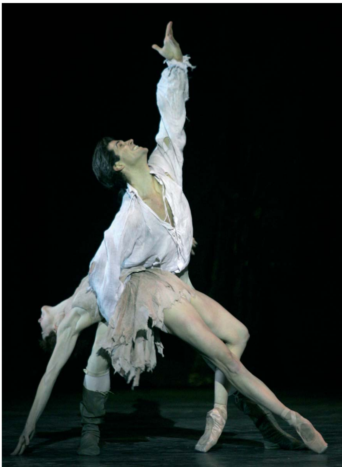
L'Histoire de Manon Musiche di Jules Massenet, arrangiate da Leighton Lucas Coreografia di Kenneth MacMillan