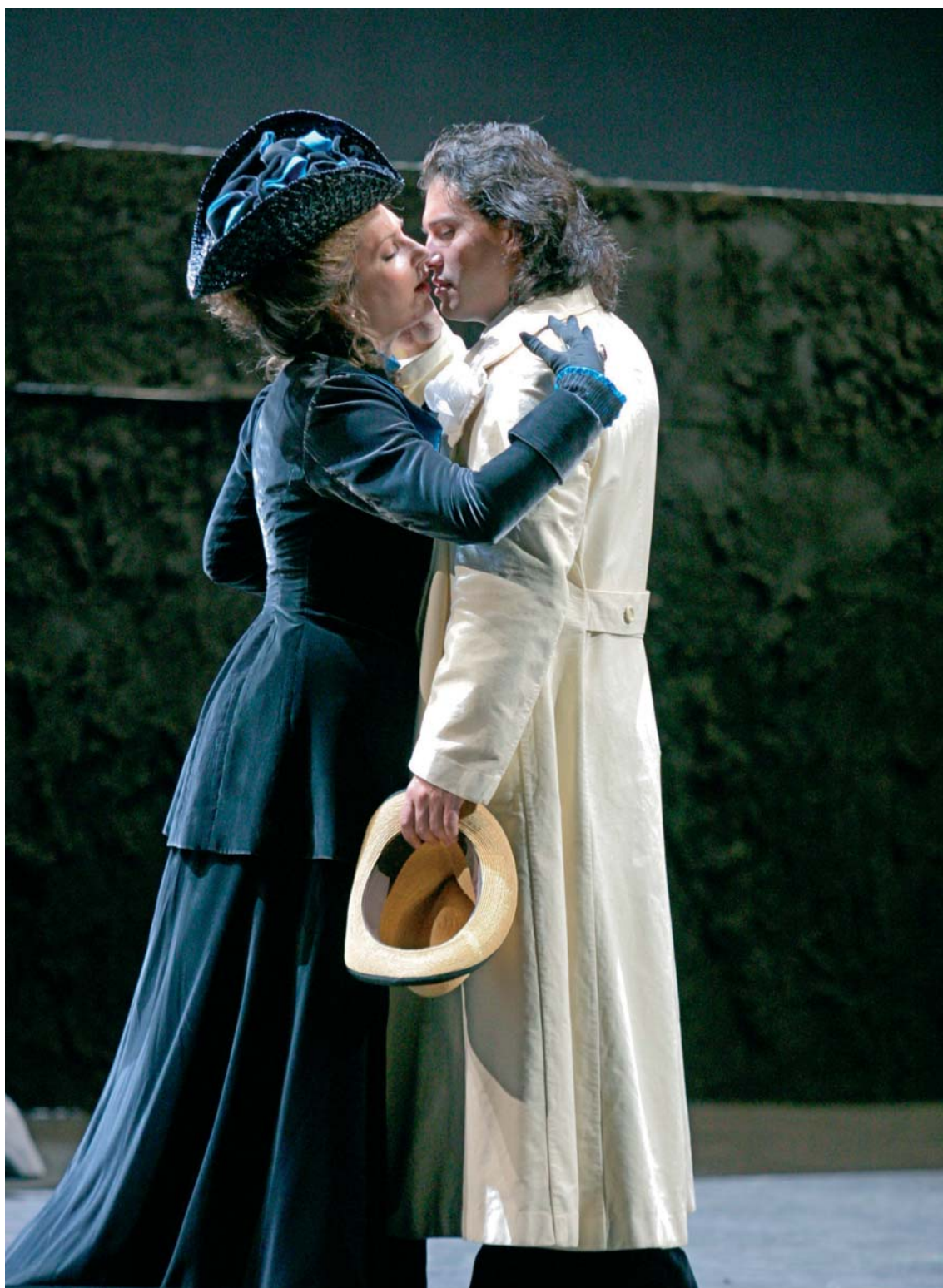
Don Giovanni Musica di Wolfgang Amadeus Mozart