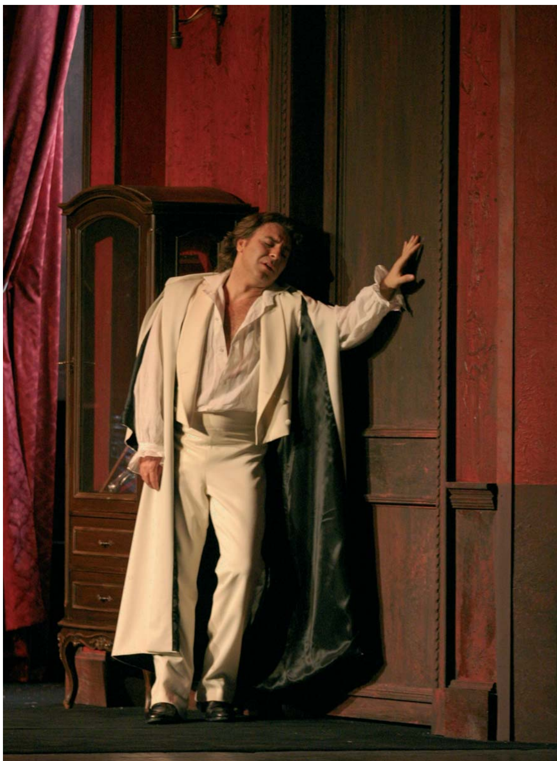
Werther Musica di Jules Massenet