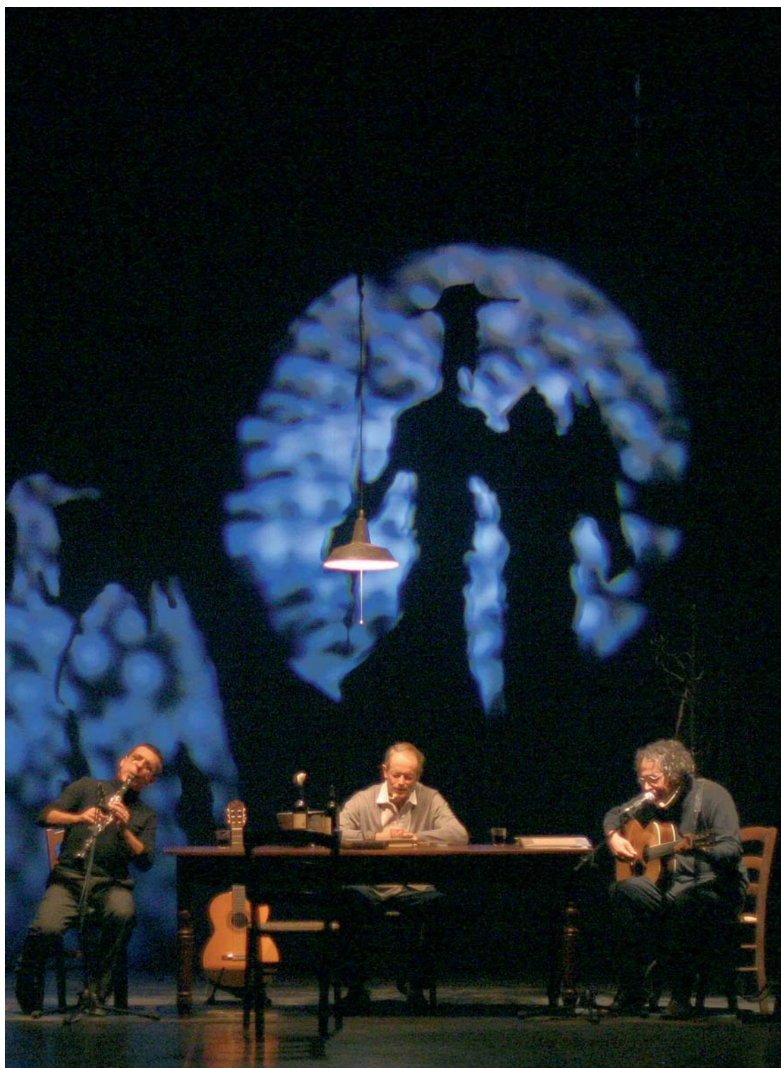
Chisciotte e gli invincibili Musica di Gianmaria Testa Piccolo Regio Laboratorio