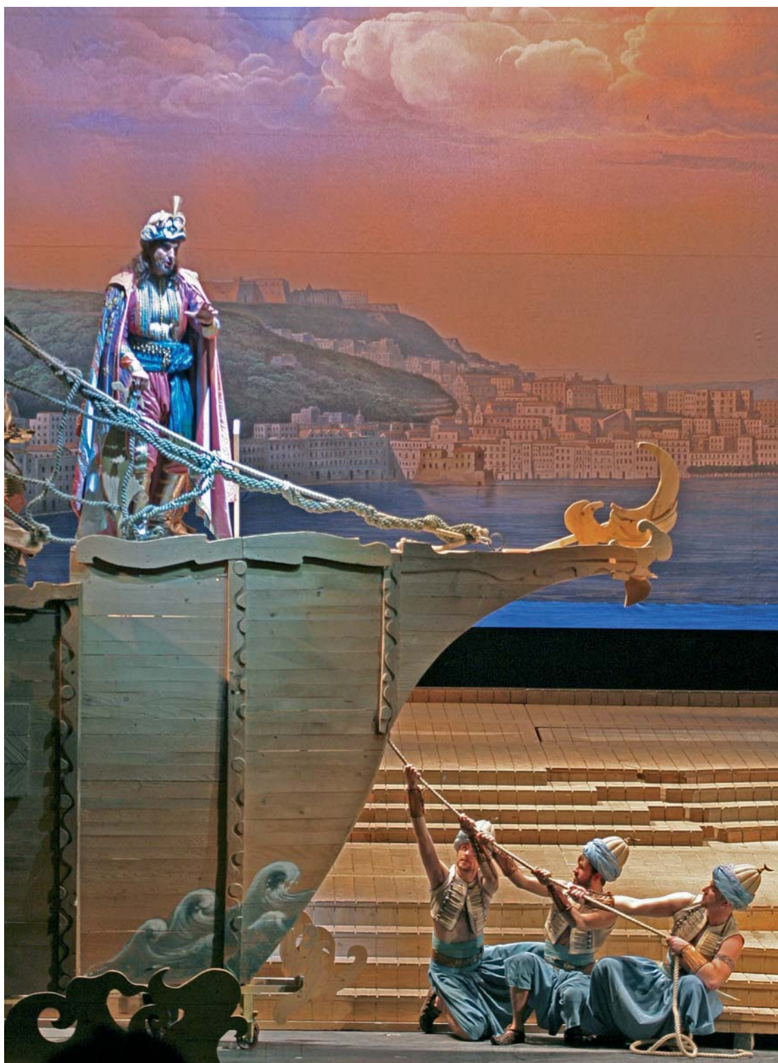
Il turco in Italia Musica di Gioachino Rossini